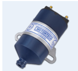
点火线圈 P/N 06.50.055