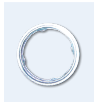
火花塞垫圈, M18 P/N 06.50.099-100

版权所有 保留 MOTORTECH 出版物中所用所有材料的版权。未经 MOTORTECH 许可, 不得以任何形式复制或传播, 例如其他电子或印刷出版物中的图片或文字。