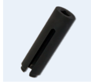
火花塞套筒 P/N 07.99.022-6-2