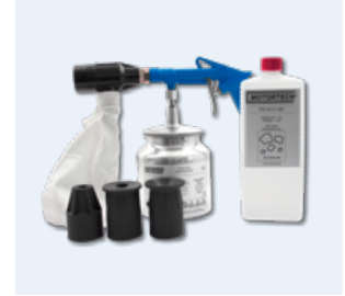
火花塞清洁套件 P/N 44.01.023