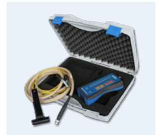
火花塞电压指示器 P/N 06.50.099-100